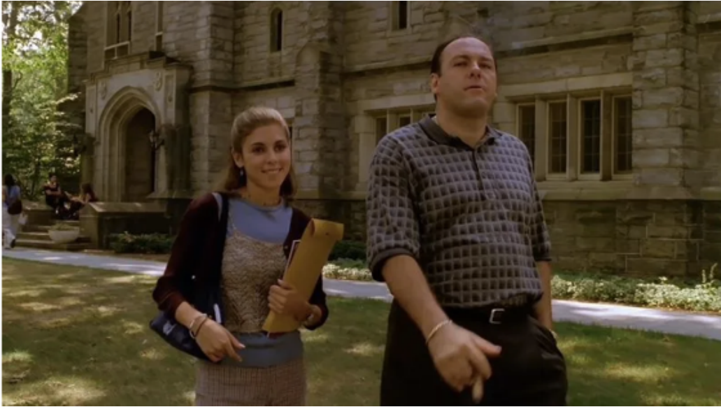
FIGURE 2 – College (1999) : Meadow et Tony (capture d'écran)

On pourrait croire, au début de l'épisode, que les relations familiales de Tony s'améliorent car il entame une conversation assez sincère – reconnaissant notamment qu'il appartient à la Mafia – avec sa fille Meadow dans la voiture qui les conduit d'université en université pendant le college tour . Mais Tony « rechute » en apercevant un repent (qui a peut-être causé indirectement la mort de son père) : il se met en tête de l'éliminer. D'un point de vue structurel, à partir du moment où ce repent l'a, lui aussi, reconnu, il ne peut être question que de vie ou de mort : tuer ou être tué comme dans un bon film de mafia (Tony ainsi que Meadow échappent d'ailleurs à la mort de justesse). Du point de vue matriciel, cet épisode est plus déterminant que l'épisode 6, « Pax Soprana », dans la mesure où il montre que Tony ne peut se soustraire à ses démons, alors que, précisément, l'épisode montre que la vie de repent pourrait être enviable par certains aspects, notamment la vie familiale. Tony observe ainsi, caché, une scène intime dans un jacuzzi, sans doute plus heureuse que dans son propre foyer. De même, Meadow représente une autre vie possible, hors de la mafia, grâce aux études, que Tony, lui, par fatalité familiale (ses « parents et grands parents étaient dedans » – la Mafia), a dû interrompre. D'un point de vue structurel, il est intéressant que nous n'ayons plus besoin d'un espace-tampon, celui des séances de thérapie, pour