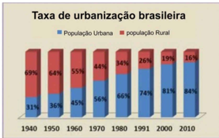
Figura 1: Aumento da urbanização por décadas.

Esse sistema de classes nascido em áreas rurais sobreviveu nas cidades, uma vez que a urbanização e a industrialização no Brasil foram tardias. De acordo com a Figura 1, pode-se afirmar que a população urbana superou, de forma significativa, a população rural apenas nos anos 1980. Outra questão importante : o processo, complexo e não linear, de urbanização e industrialização do Brasil foi resultado, antes de tudo, do investimento de proprietários rurais, de comerciantes exportadores e importadores, de banqueiros brasileiros e do Estado, particularmente a partir dos anos 1930 e durante os anos 1950 a 1980. Evidentemente, a industrialização mais recente foi feita com os investimentos dos conglomerados financeiros internacionais que influenciaram na economia brasileira a partir de 1956, com o governo de Juscelino Kubitschek (1956-1961), assim como durante os governos militares (1964-1985).