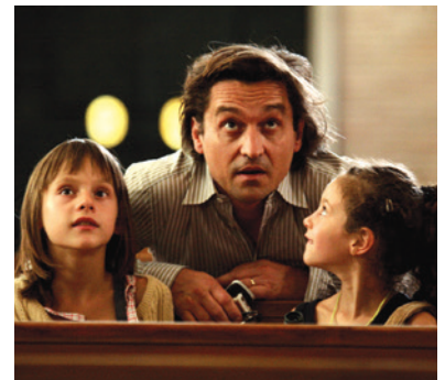
— Le père de mes enfants