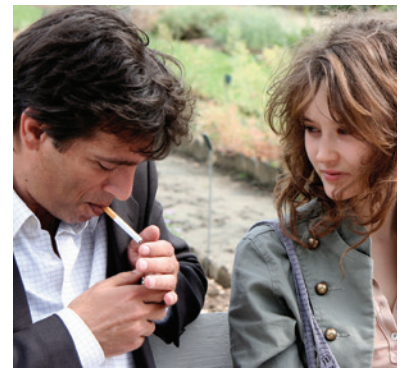
— Tout est pardonné