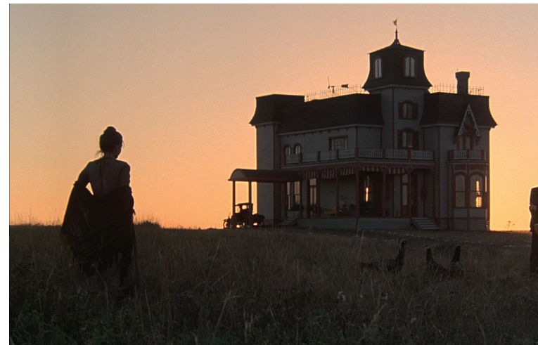
Days of Heaven

chrétien, de croire en Dieu, et de savoir que, scientifiquement, il y a une partie de la Bible à jeter dans les poubelles, ou pas loin. Je pense que Voyage of Time est le film le plus anti-crétionniste de l'histoire du cinéma, alors que c'est un chrétien qui l'a réalisé. C'est un drôle de paradoxe. Loin de correspondre à l'idée qu'on se fait d'un film chrétien, Voyage of Time est extrêmement scientifique dans son approche. Il suffit de regarder la liste de collaborateurs scientifiques qui défile dans le générique de fin, c'est incroyable.