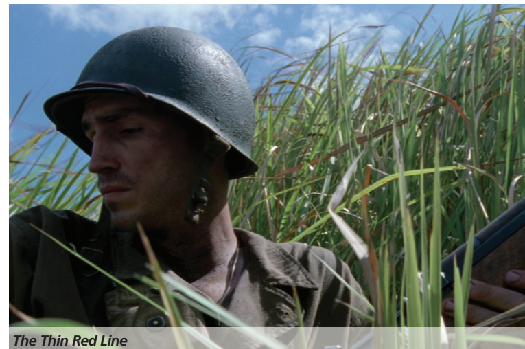
The Thin Red Line

Le livre se construit selon un axe qui a longtemps été difficile à définir, et qui prend appui sur trois plans de regards. Tout d'abord, on commence à observer le sol, soit la terre américaine, autour de laquelle se développent les questions de l'expansion, de la possession du territoire, de la violence et la destruction. C'est autour de cette déclinaison que se construit toute la première partie du livre. J'ai voulu ainsi démontrer comment ces questions se ressentent à travers une large partie de son œuvre ( The New World, Days of Heaven, The Thin Red Line ). Dans la deuxième partie, on lève le regard vers tout ce qu'il y a autour de nous, l'environnement au sens large. Donc, tout ce qui est visible par une présence terrestre. Tout ce que les sens peuvent percevoir, entendre et atteindre... J'ai cherché par-là à démontrer la particularité du cinéma de Malick et ce qui le caractérise (les images, le montage, le jeu des échelles, la musique...) C'est vraiment dans cette partie que je parle le plus de la mise en scène. Et finalement, dans la troisième partie, on porte le regard au-dessus de nous, même vers des hauteurs invisibles. Ce qui permet d'interroger tout ce qui a trait à la religion et à la spiritualité de son cinéma. Ce fil conducteur a été nécessaire pour aboutir à une clarté d'analyse et afin de ne pas me disperser.