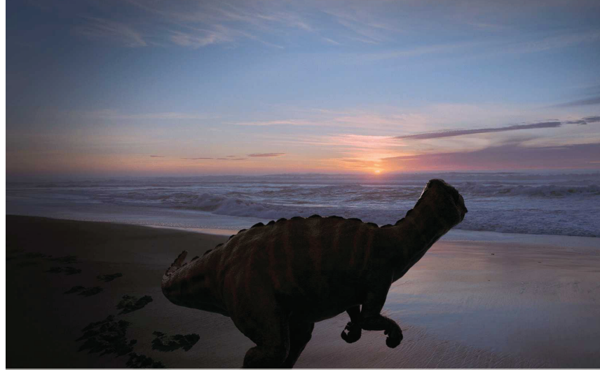
Voyage of time

Avec un film comme Le nouveau Monde , on retrouve selon moi la plus belle de toutes les voix-off de son cinéma. L'anglais sert de langue adamique, au sens de langage unique compris de tous. Pocahontas ne parle pas encore l'anglais que sa voix-off s'exprime avec cette langue. Cela n'est pas dû à une quelconque question de production. C'est plutôt parce que c'est à travers cette voix-off que les deux personnages principaux vont arriver à communiquer. C'est par elle que se crée la communication entre deux solitudes éloignées, dont l'entrechoc participe à une forme de dialogue entre eux. Et puis dans un film comme The Tree of life , Malick radicalise la voix-off qui déclame des questions purement spirituelles et poétiques. Depuis, elle n'a plus beaucoup