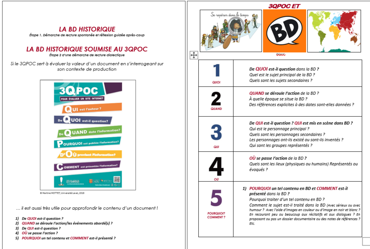
Figure 2. Document 3QPOC-BD distribué aux participantes