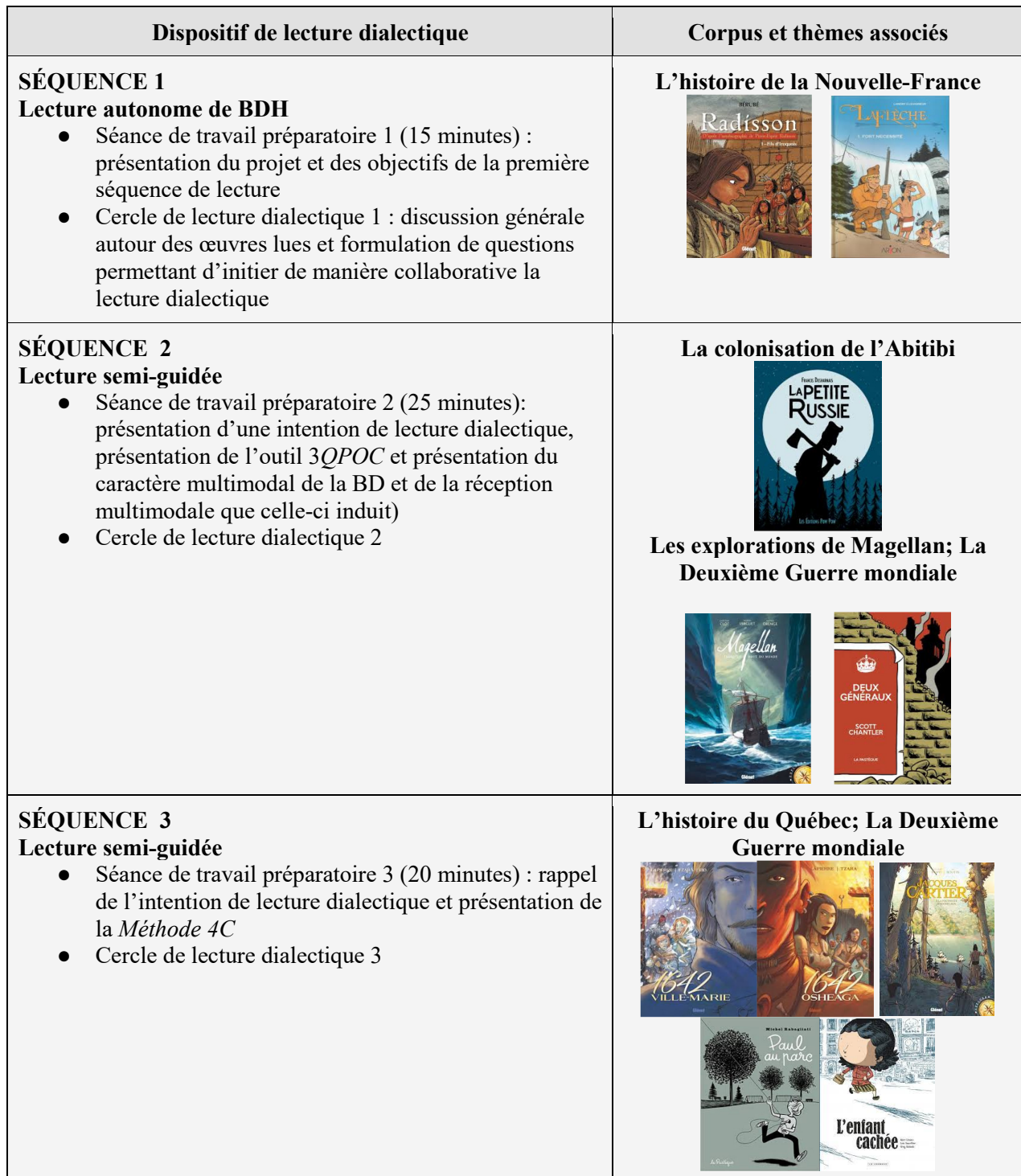
Tableau 1 Dispositif de lecture dialectique (prototype 1)