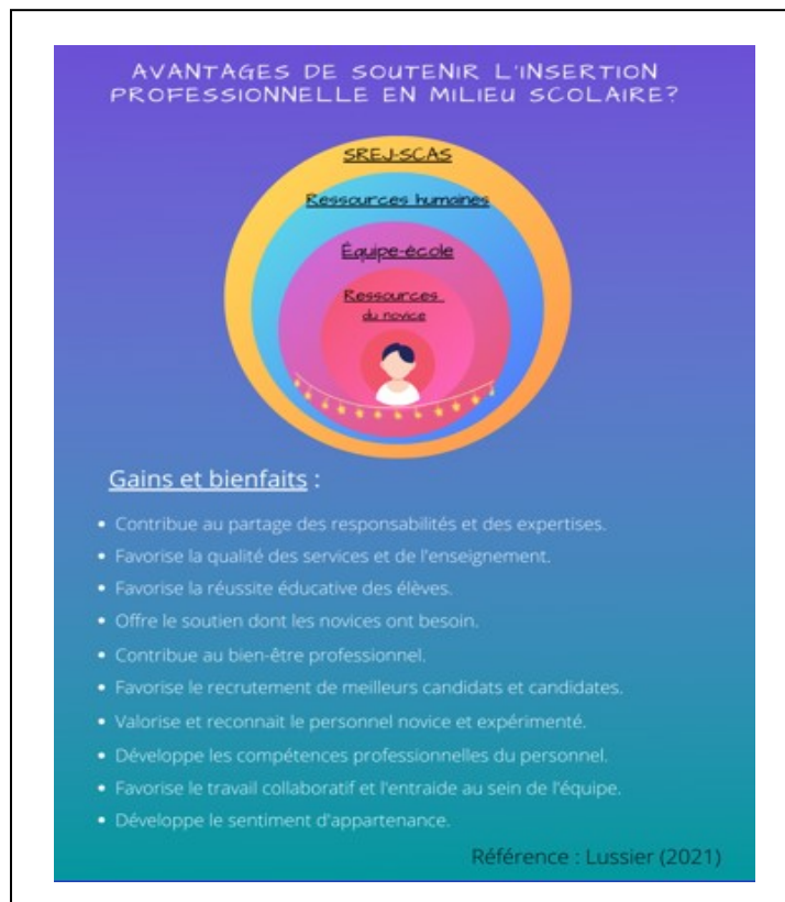
Figure 4 : Avantages de soutenir l'insertion professionnelle en milieu scolaire ? (Lussier, 2021)

Cette figure présente le personnel novice au centre de ses propres ressources et de son équipe-école par des couleurs chaudes et sous la guirlande d'étoiles afin de symboliser l'importance de soutenir au quotidien le vécu et le ressenti du personnel novice. Le Service des Ressources Humaines (RH) et le Service des Ressources Éducatives aux Jeunes ainsi que les Services Complémentaires et de l'Adaptation Scolaire (SREJ-SCAS) 3 sont des entités plus lointaines du vécu quotidien du personnel novice au sein des équipes-écoles. Il apparaît important de mettre en lumière leur apport à l'IP.