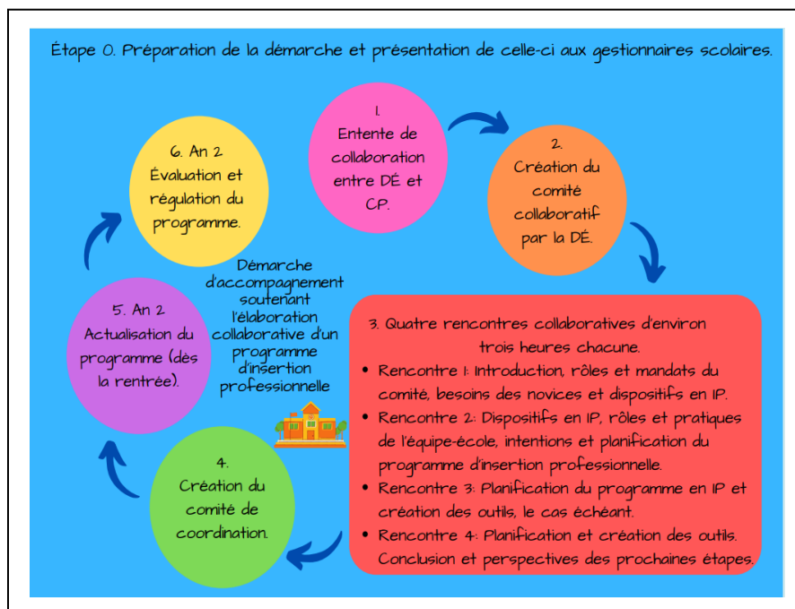
Figure 1 : Démarche d'accompagnement soutenant l'élaboration collaborative d'un programme d'insertion professionnelle

scolaire. Les étapes 5 et 6 se déroulent habituellement à l'an 2 de la démarche et veillent à la mise en place du programme d'IP, ainsi qu'à la régulation et à l'évaluation de celui-ci. Les étapes 5 et 6 sont pilotées par le comité de coordination et ce comité est accompagné par la personne conseillère pédagogique.