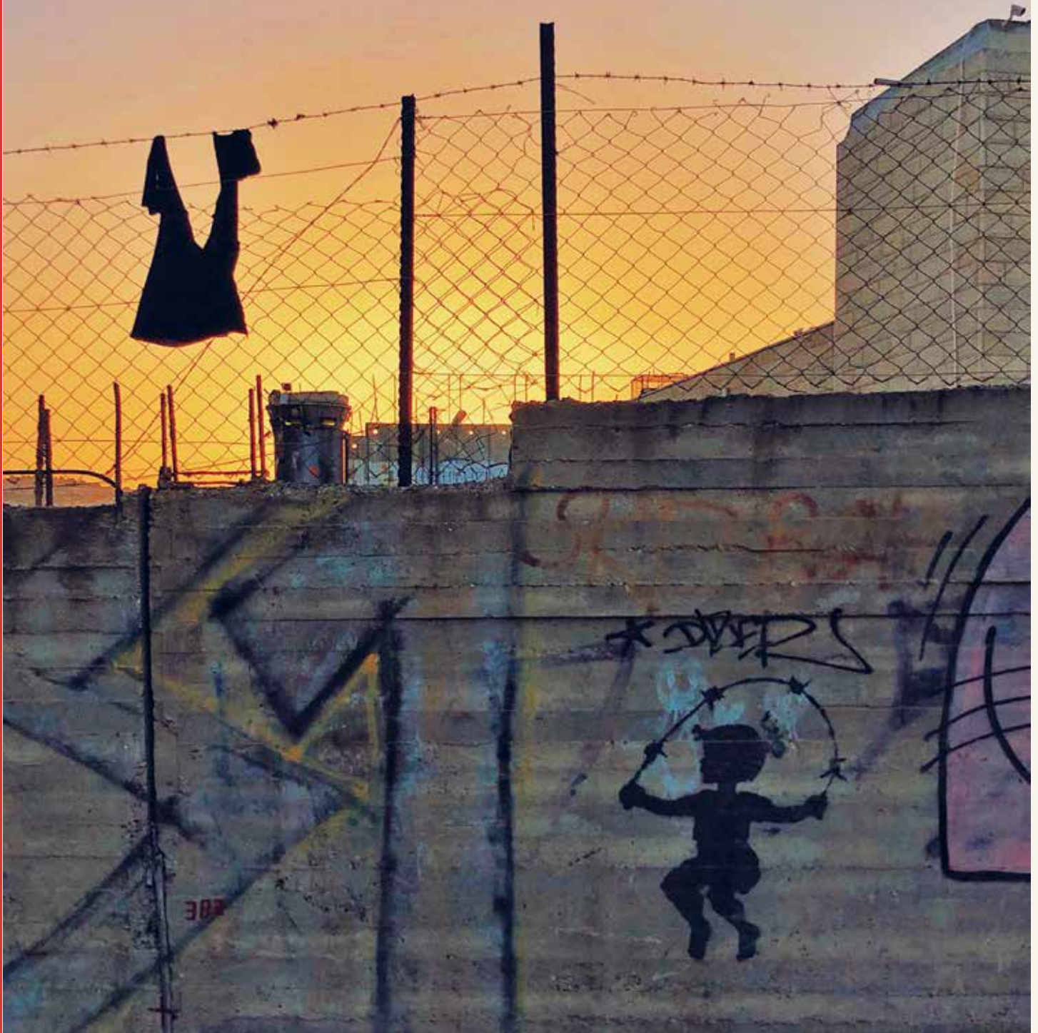
Cake$, Une petite fille qui saute à la corde avec du fil barbelé , 2017. Photo: Amir Mauge, 2020.