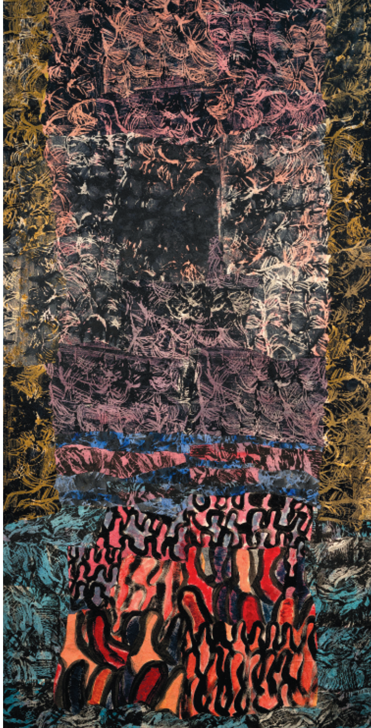
Jocelyn Ann Campbell, Climats et fractures G , 2017, acrylique et collage, 76 x 152 cm

Vouloir décoloniser notre modernité pour entendre l'interpellation des groupes qui sont toujours victimes de colonialisme ne revient pas pour autant à vouloir faire table rase de notre histoire complexe en ce qui a trait au fait colonial, ni faire preuve d'une xénophilie pathologique qui n'arrive à voir beauté et grandeur que dans « l'autre » non blanc. Cela ne veut pas dire, non plus, rêver d'un retour à une ère prémoderne fantasmée, mais bien sauver d'elle-même la tradition moderne et l'idéal d'émancipation qu'elle porte. Il s'agit en somme de trouver des terrains communs avec ceux et celles qui sont exclus ou victimes de nos institutions et de notre rapport au monde afin d'élargir nos conceptions du commun. Et, à partir de la solidarité des luttes