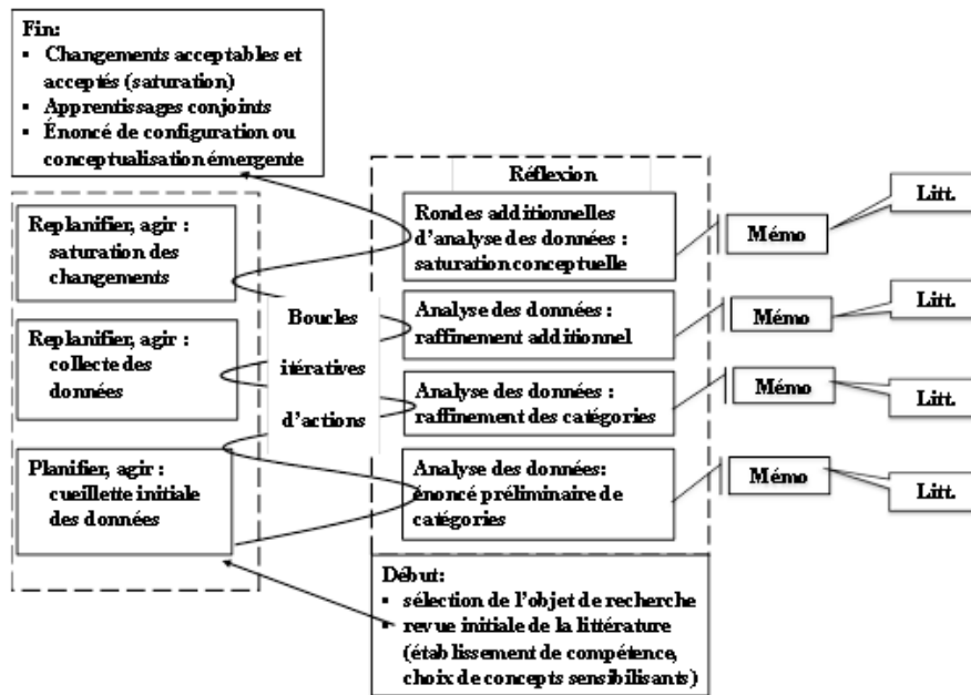
Figure 2. La démarche de réflexion sur l'action par le mémo (adaptation à partir de Prévost et Roy, 2013).

C'est à partir du choc des différents points de vue des participants aux intérêts divers, incluant celui des chercheurs, dans le milieu concerné par la recherche-action, qu'une représentation partagée de la problématique peut émerger et servir de base à l'élaboration conjointe d'un plan d'action qui mobilisera l'énergie et l'intérêt de tous. Le partage en public du diagnostic initial de la problématique permet de démontrer à toutes les personnes concernées l'importance d'agir et leur capacité à converger et à collaborer en vue d'améliorer les choses dans un futur qui a du sens pour tous.