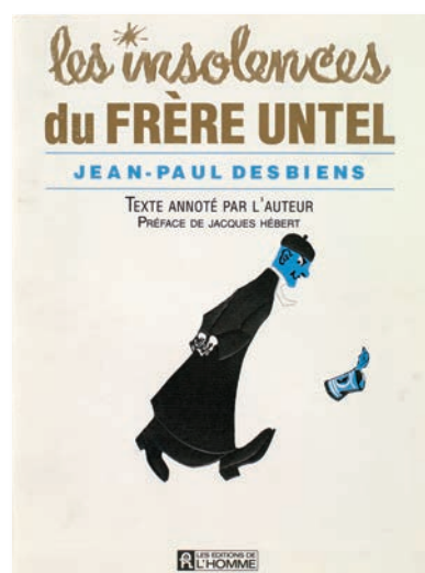
3. Jean-Paul Desbiens, Les insolences du frère Untel , texte annoté par l'auteur, Montréal, Éditions de l'Homme, 1988, 258 p. BAnQ, Collection patrimoniale [971.404 D443i 1988].

Si un livre demeure emblématique du déclenchement de la Révolution tranquille au Québec, c'est bien celui de Jean-Paul Desbiens : avec plus de 100 000 exemplaires vendus en six mois, le tirage de ce best-seller , tout en révélant le succès de la politique éditoriale dynamique mise en œuvre par les Éditions de l'Homme de Jacques Hébert 2 , démontre la forte résonance qu'a connue cet essai à couleur polémique. La genèse de cet ouvrage, son contenu, sa réception et ses effets sur la société québécoise de l'époque sont bien connus, notamment grâce à l'importante réédition parue en 1988 aux Éditions de l'Homme, annotée par l'auteur et augmentée d'une préface rétrospective de l'éditeur Jacques Hébert 3 (ill. 3). Les insolences ont été construites à partir d'un échange de lettres entre Frère Untel et l'intellectuel André Laurendeau, publiées entre novembre 1959 et avril 1960 dans le journal Le Devoir . Rédigé en une quinzaine de jours sur cette base, le livre de Jean-Paul Desbiens se compose de deux parties : « Frère Untel démolit », tout d'abord, où l'auteur laisse libre cours à sa verve de polémiste en mettant en cause, dans quatre chapitres, le système d'enseignement en vigueur au Québec, particulièrement en