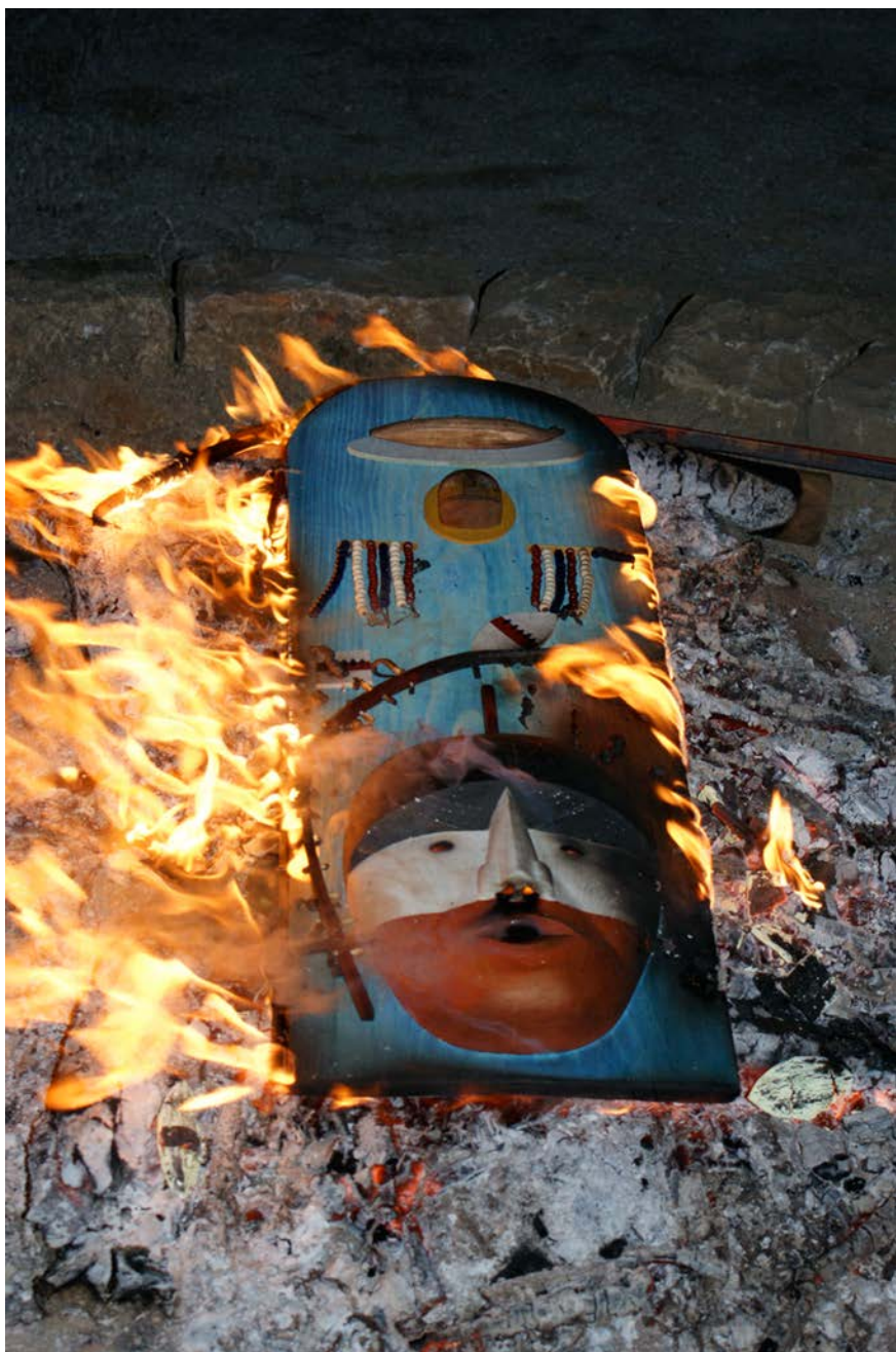
Masque réalisé par Perry Eaton, rituellement brûlé dans la cour du Château Musée de Boulogne-sur-Mer, 30 septembre 2011

les masques de Kodiak sont sortis des caisses pour être présentés, à l'occasion du xx e Congrès des américanistes, lors d'une exposition temporaire au Musée de l'Homme (anciennement Musée du Trocadéro), où ils resteront jusqu'en 1950.