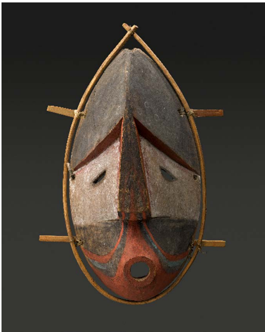
Masque traditionnel chumliq : « Le premier » Bois, tendon, peinture, XIX e siècle

Cet atelier, piloté par Sven Haakanson, a joué un rôle déterminant dans la compréhension mutuelle entre le personnel du musée de Boulogne et ces artistes émus aux larmes devant les objets-témoins de leur culture perdue. Il a constitué le facteur