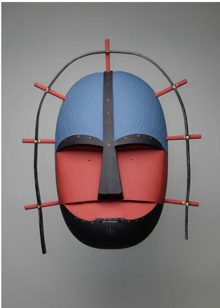
Whale Hunter / Le chasseur de baleine Masque contemporain réalisé par Jacob Simeonoff, 2010 (© Ville de Boulogne-sur-Mer, n° inventaire 2012.3.1) (Source : http://musee.ville-boulogne-sur-mer.fr/images/presse-alaska/masque-whale.jpg )

aux côtés des masques, une sélection d'objets de la vie quotidienne, des maquettes d'embarcation, des éléments de parures et des instruments de musique ainsi que quelques œuvres contemporaines. Les pièces étaient exposées par thèmes, et la scénographie incluait des extraits des carnets de voyage de Pinart. L'exposition mettait l'accent sur la vie quotidienne comme sur les rituels, en particulier les festivals d'hiver, liés à la chasse et rythmés par les chants et danses au cours desquels étaient portés les masques.