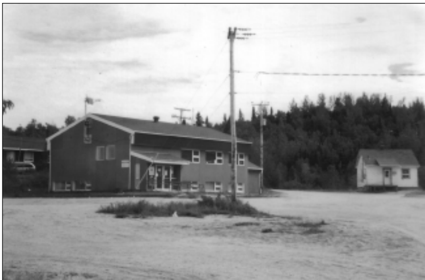
Figure 3 Le conseil de bande de Manawan, août 2003

Le conseil de bande est également le principal employeur dans la communauté. Outre les élus, le conseil de bande emploie du personnel de bureau et certains spécialistes (administrateur, gestionnaire, personne ressource en charge des travaux publics). Les emplois d'entretien de la communauté, de construction, d'enseignement, sont aussi déterminés par le conseil de bande. Il n'est pas étonnant de constater à la suite d'une élection, un renouvellement dans le personnel de soutien. Le changement des élus du conseil de bande est comparable à un changement de parti politique au sein du