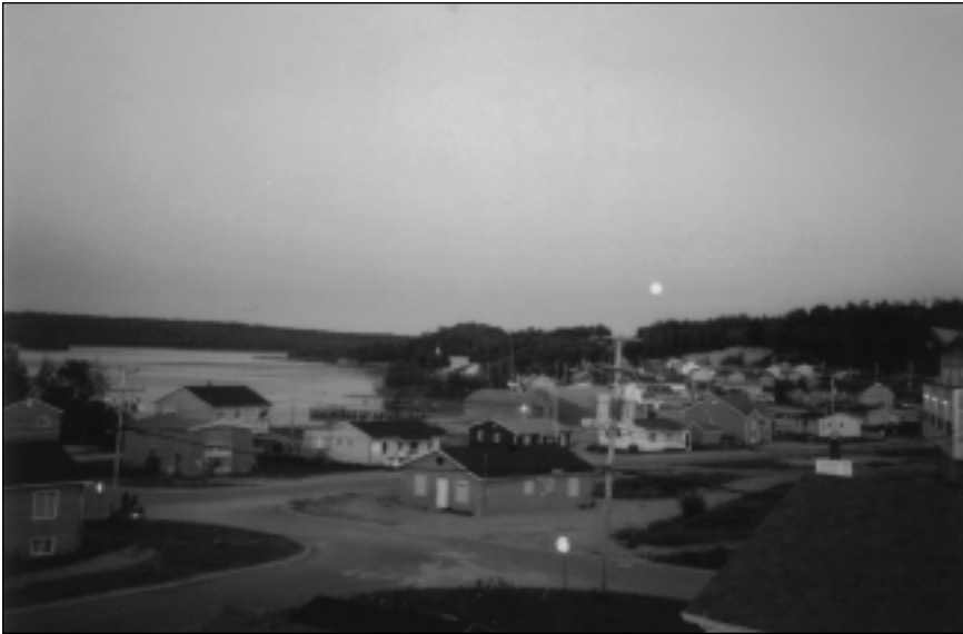
Figure 1 Le Bas Manawan, situé sur les berges du lac Métabeskéga (lac Madon), août 2003

contact qui ont touché la façon atikamekw de se définir l'un envers l'autre et envers le territoire.