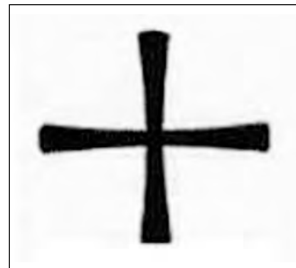
Figure 2 L'étoile et la croix de Malte