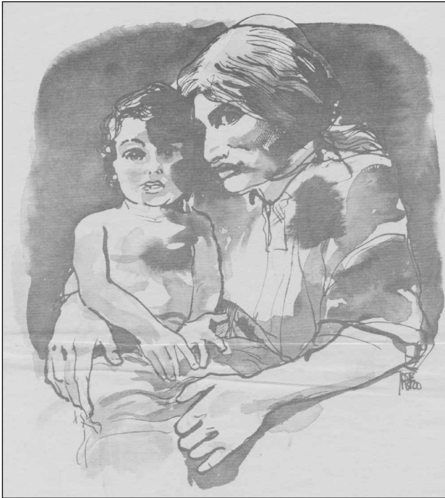
« De l'Ours et de la Femme, naquit un enfant, dans la montagne... » (Source : Ortigoza Tellez 1980 : 5)

fuite et à retourner dans son village. Ici encore, la traversée de la rivière symbolise le passage de la Nature à la Culture : l'Ours n'y arrive pas.