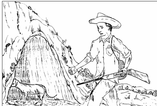
« Ses chiens entrèrent dans la grotte à la poursuite des pécaris. »

(Source : Taller de Tradición Oral del CEPEC et Beaucage 1998 : 182)