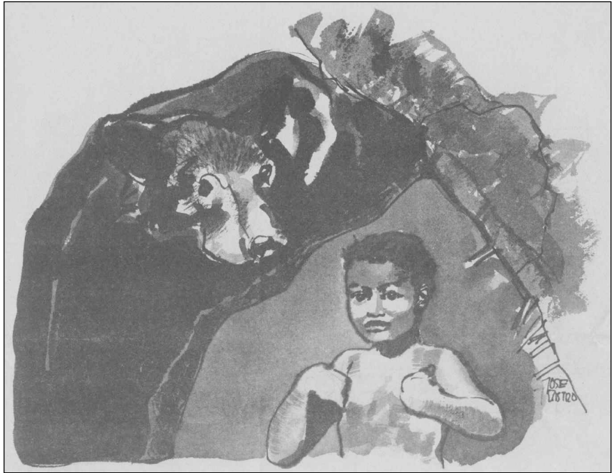
« L'enfant grandit, grandit et devient très fort. » (Source : Ortigoza Tellez 1980 :10)

Le Taller de Tradición Oral a recueilli plusieurs versions de ce récit. Certaines mettent en scène des chasseurs, d'autres des