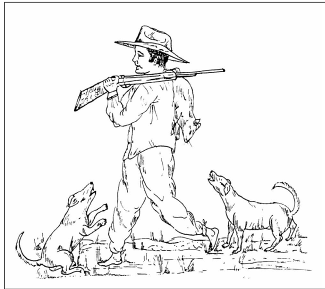
« Il y avait un chasseur, un bon chasseur, qui partait tous les jours avec ses chiens. »

Le boa, par contre, ne représente pas uniquement l'abondance de la Nature, mais aussi sa force, qui peut être néfaste pour les humains comme l'a été la force de l'Ours. Ainsi, les épisodes [7] et [8] portent également sur la transformation d'un être naturel en quelque chose de compatible avec la vie sociale et culturelle. Une tâche difficile et dangereuse. Si l'on se rappelle le récit de Juan Oso, le problème principal ne semble pas être ce qui manque aux animaux pour devenir humains, mais plutôt l' excédent de puissance dont sont investis certains animaux par les Maîtres de la Nature. Le processus humanisant demande un geste courageux de la part du chasseur : « sauter par dessus un serpent » est une chose que personne ne ferait dans la vie réelle. Le Vieux Couple met ainsi le chasseur à l'épreuve en testant son courage, sa foi en eux, et sa bonne volonté. Le mouvement pourrait également symboliser de futures, et non d'actuelles, relations sexuelles. Le mot nahua vulgaire signifiant avoir des relations sexuelles avec une femme est -iksa (« appuyer sur ») ou, de manière encore plus claire, -soniksa , (« appuyer sur le pubis »). Ici, le chasseur enjambe la Femme