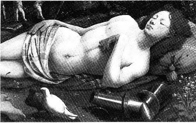
Figure 6 Piero di Cosimo, Vénus, Cupidon et Mars, vers 1486-1510, huile sur panneau, 72 x 182 cm, Gemäldegalerie, Berlin, détail

tre, de loin, les effets sensibles et pathétiques dans leurs modulations historiques et culturelles.