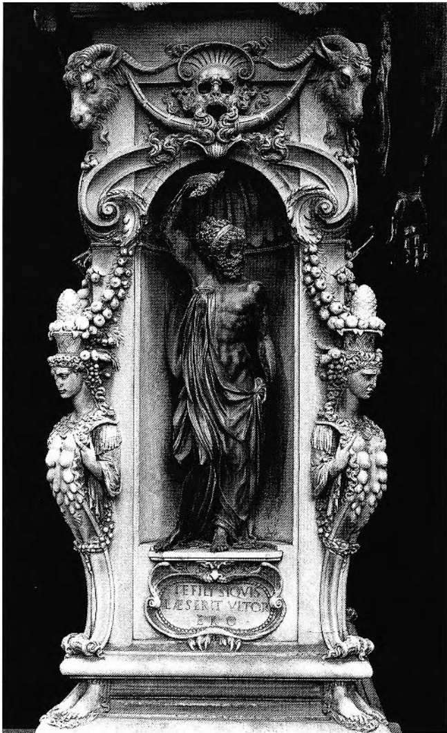
Figure 4. Benvenuto Cellini, Persée , 1545-54, piédestal de marbre, Florence, Loggia dei Lanzi (Photo : Alinari / Art Resource, NY).

cette Nature est souterraine, démoniaque ou surnaturelle, relevant de l'imagination. La « Nature » comprend toute la gamme de l'être, du sublimement céleste et du surnaturel au « sous-naturel » pour ainsi dire et au grotesque, en passant par l'humain, le quotidien et l'observable. La création aussi bien d'êtres surnaturels et supérieurs que d'êtres démoniaques et dénaturés reste le produit de l'imagination de l'artiste, qui se fonde néanmoins toujours sur l'étude de l'humain, de l'animal, et du végétal et ne leur donne une place que s'il peut les garder sous sa maîtrise et à son service.