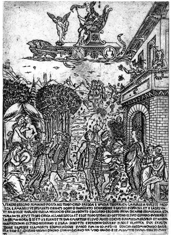
Figure 1. Atelier de Baccio Baldini ?, Vénus et ses Enfants, gravure florentine sur cuivre, 1464-65, Londres, British Museum.