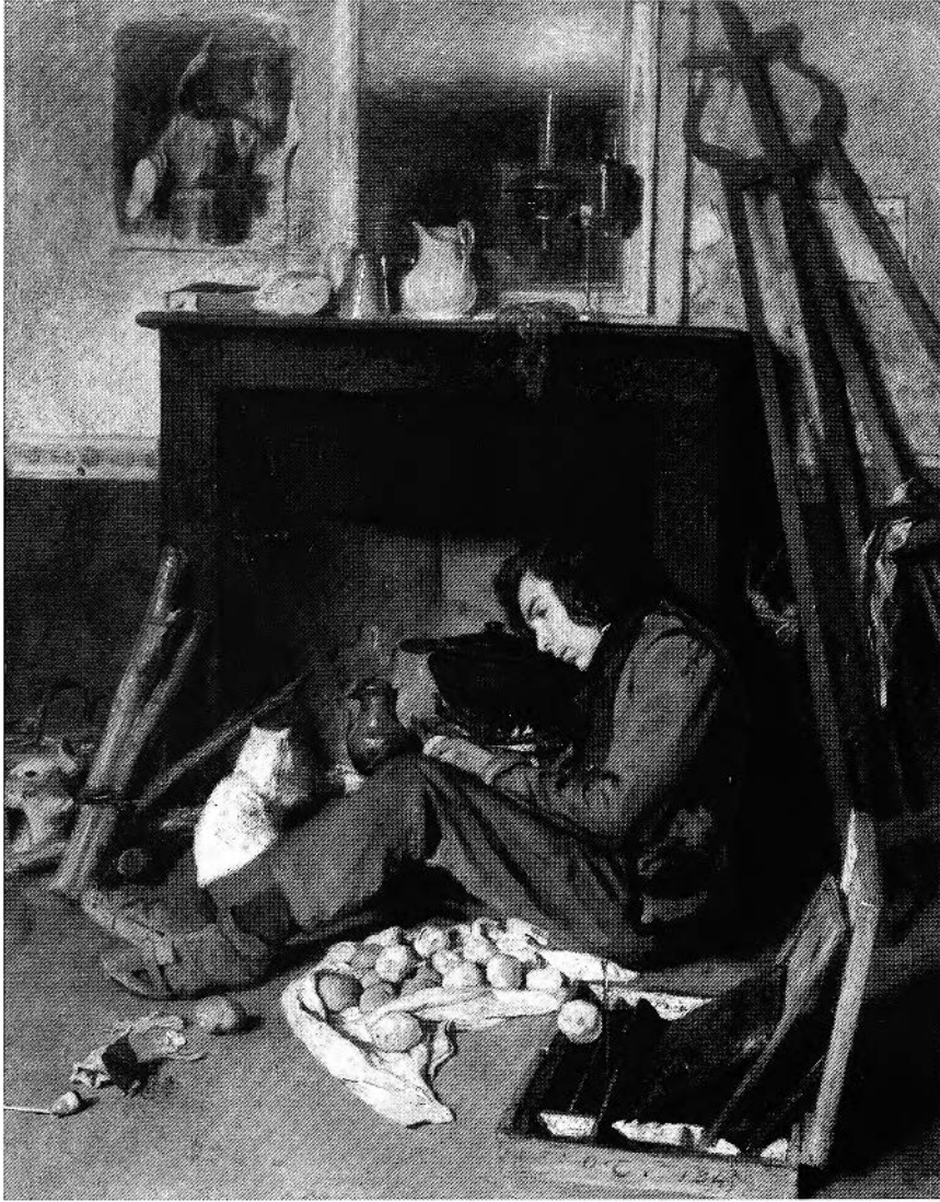
Figure 2. Octave Tassaert, Intérieur d'atelier , 1845, huile sur toile, 46 × 38 cm, Paris, musée du Louvre (crédit photographique: Giraudon, Paris).

nement physique ou matériel et ne plus l'isoler comme un génie solitaire. D'autres récits ont déjà traité du milieu artistique mais aucun ne semble aussi complet 45 . Dans La Rabouilleuse de Balzac, alors que Joseph exerce le métier d'artiste peintre, c'est Philippe Bridau, son frère, qui demeure le héros de l'histoire ; et si l'auteur détaille quelque peu l'éducation de Joseph, il reste succinct sur ses fréquentations, sa carrière, etc. Par ailleurs, les nouvelles de Balzac sont trop brèves pour faire l'objet d'une analyse détaillée du rôle métonymique de l'atelier comme Le Chef-d'œuvre inconnu , La Maison du chat-qui-pelote , La Bourse , etc. On pourrait également signaler qu'Alexandre Dumas (fils) a publié, dès 1861, avec Affaire Clémenceau – Mémoire de l'accusé , un roman qui met en scène un sculpteur. Mais l'écrivain développe surtout la relation entre les deux amants, Pierre Clémenceau et Iza Dobronowska, qu'au milieu dans lequel l'artiste devrait