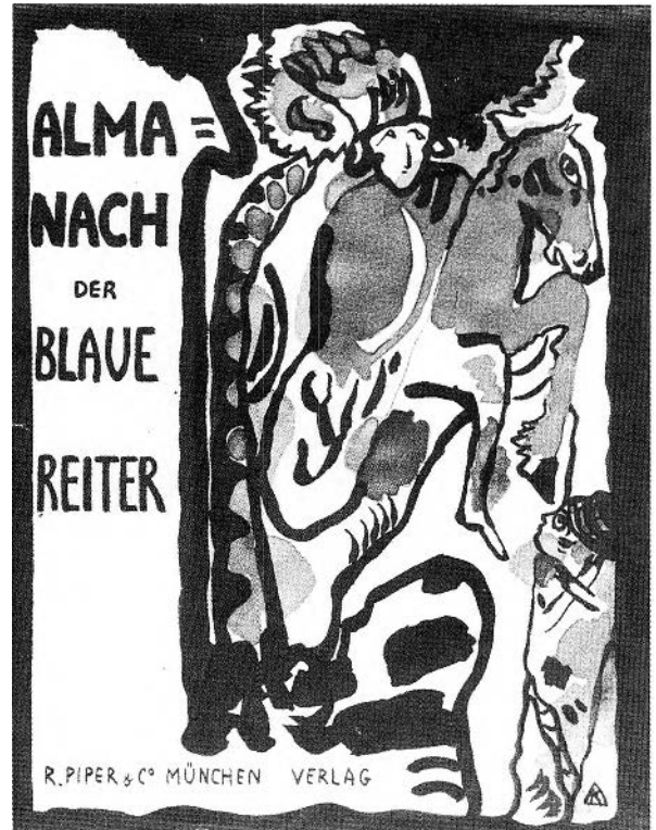
FIGURE 94. W. Kandinsky, Almanach des Blaue Reiter , 1912. Gravure sur bois 27,9 × 21 cm. Munich, Städtische Galerie im Lenbachhaus (Photo: Städtische Galerie im Lenbachhaus, Munich).