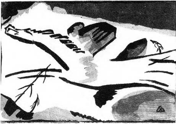
FIGURE 92. W. Kandinsky, Lyrisches , 1911. Gravure sur bois, 14,5 × 21,7 cm. Munich, Städtische Galerie im Lenbachhaus.