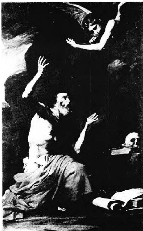
FIGURE 28. Jusepe de Ribera, Saint Jérôme et l'Ange du Jugement dernier , 1626, huile sur toile (262 × 164 cm.). Museo e Gallerie Nazionali di Capodimonte, Naples.