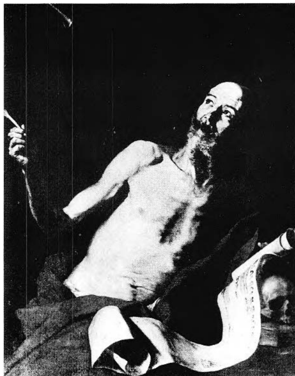
FIGURE 29. Jusepe de Ribera, Saint Jérôme , 1629, huile sur toile (125 × 100 cm.). Galleria Doria Pamphili, Rome (Photo: Reproduite d'après l'ouvrage de Jonathan Brown, Jusepe de Ribera: Prints and Drawings [Princeton, 1973]).