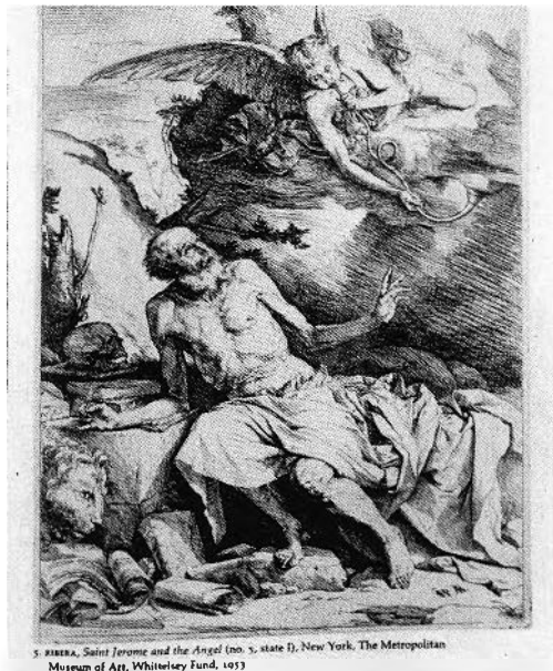
FIGURE 26. Jusepe de Ribera, Saint Jérôme et l'Ange , 1621, eau-forte (31.8 × 23.8 cm.). Hispanic Society of America, New York (Photo : Reproduite d'après l'ouvrage de Jonathan Brown, Jusepe de Ribera: Prints and Drawings [Princeton, 1973]).