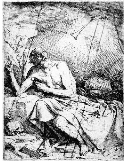
FIGURE 27. Jusepe de Ribera, Saint Jérôme et la trompette du Jugement dernier, 1621, eau-forte (32.5 × 24.6 cm.). The Metropolitan Museum of Art, New York, The Elisha Whittelsey Collection, The Elisha Whittelsey Fund, 1953 (53.512.5).