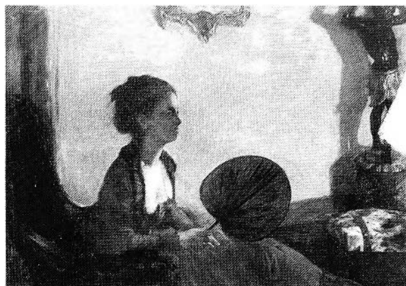
FIGURE 100. Edgar Degas, Mme Camus en rouge , 1870, huile sur toile. Washington, National Gallery of Art. Collection Chester Dale (Photo: National Gallery of Art, Washington, D.C.).