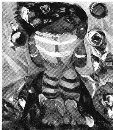
FIGURE 1. Paul-Émile Borduas, La Fustigée , huile sur toile, 56 × 22 cm, s.d.b.g. : 'Borduas/41-46.' Musée des beaux-arts de Montréal, don du docteur Max Stern.

Le texte de Monique-Suzanne Gauthier, en plus d'être bien informé et parfaitement clair – il mériterait d'être publié – aide à comprendre les raisons qui ont motivé le choix des tableaux accompagnant La Fustigée . Le plus difficile à expliquer à première vue est Composition bleu-blanc-rouge , mais sa présence se justifie par le fait que ce tableau a servi dans la transaction par laquelle Borduas était rentré dans la possession de son Nu de dos de 1941, acquis deux ans après par maître Joseph Barcelo à l'exposition de la Dominion Gallery, pour le transformer en Fustigée en 1946. Le rapport avec La Tahitienne (1941) est plus fort si on en rapproche non pas La Fustigée (1946) mais le Nu de dos révélé par la radiographie (Fig. 2). Car si La Tahitienne évoque Gauguin par son titre elle ne le fait guère autrement, alors que le Nu de dos relève bien de l'iconographie de Gauguin qui a aimé peindre ses Tahitiennes accroupies ou assises sur le sol comme