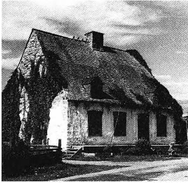
FIGURE 1. Maison Joseph-E. Soulard, Neuville. D'après Dupont.

a perçu un climat, une échelle de valeurs. Il a ingurgité, peut-être sans s'en apercevoir, une bonne dose de termes techniques, de faits historiques divers. Il a vu des hommes s'agiter et peut-être mieux compris ce qu'il est aujourd'hui. La lecture terminée, ce lecteur se garde bien de ranger le volume au rayon des ouvrages de références; il n'a pas été conçu pour cela.