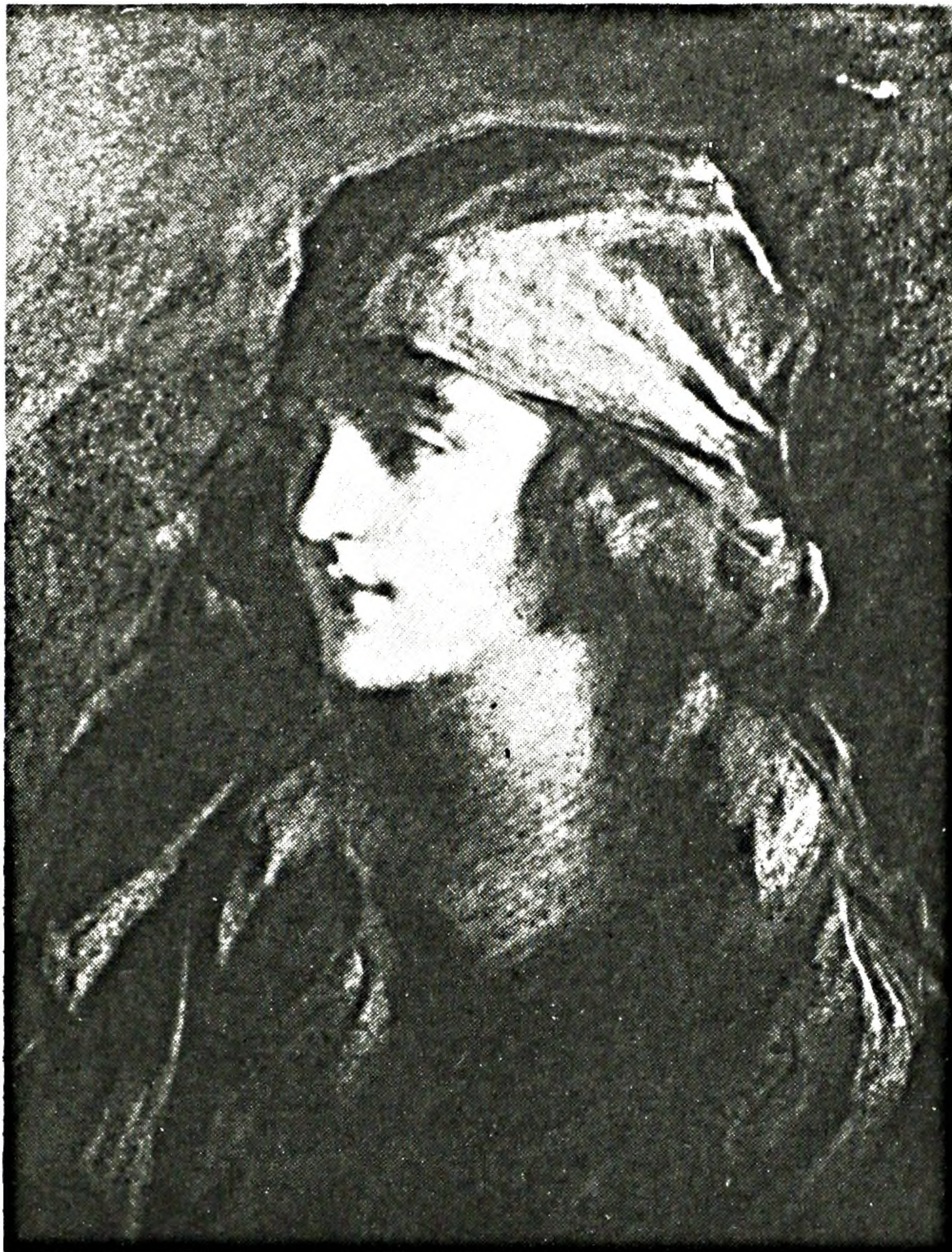
FIGURE 10. J. Saint-Charles, Jeune fille au turban , fusain et pastel. Collection de Madame Marthe Deslandes.

la suite surtout des paysages et très peu de commandes officielles; il décède à Montréal le 26 octobre 1956, à l'âge de 88 ans. Après sa mort il n'a connu qu'une seule exposition collective en 1962 75 , et deux expositions individuelles, l'une en 1966 à Montréal, alors que trente-sept tableaux étaient présentés 76 , la seconde et dernière en 1971 à l'Université d'Ottawa 77 .