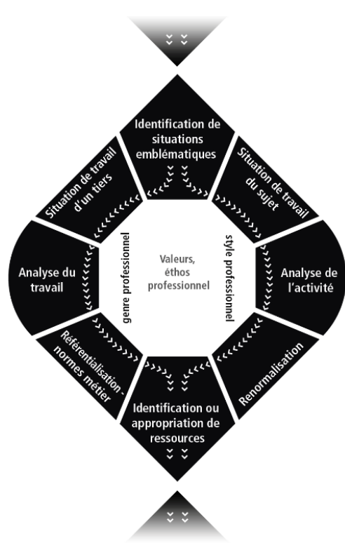
FIGURE 1: MODELE DE DIDACTIQUE PROFESSIONNELLE PAR ALTERNANCE ET SITUATION

Le modèle de didactique professionnelle par alternance et situation (DPAS) (Gremion, 2021b) se construit autour de 3 axes :