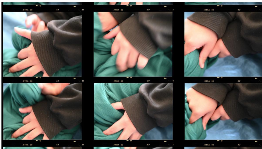
Avec la matière : images du scénario #44, « Danser la matière », lors d'un atelier d'exploration avec les élèves de seconde de l'enseignement Arts Danse. Lycée Jean Monnet, Montpellier (France).