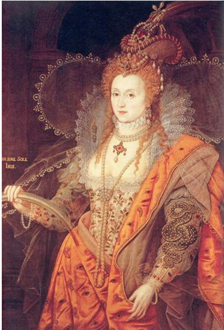
Le « portrait arc-en-ciel » d'Élisabeth I ère ; une représentation allégorique de la reine toujours jeune malgré sa vieillesse. Vers 1600.