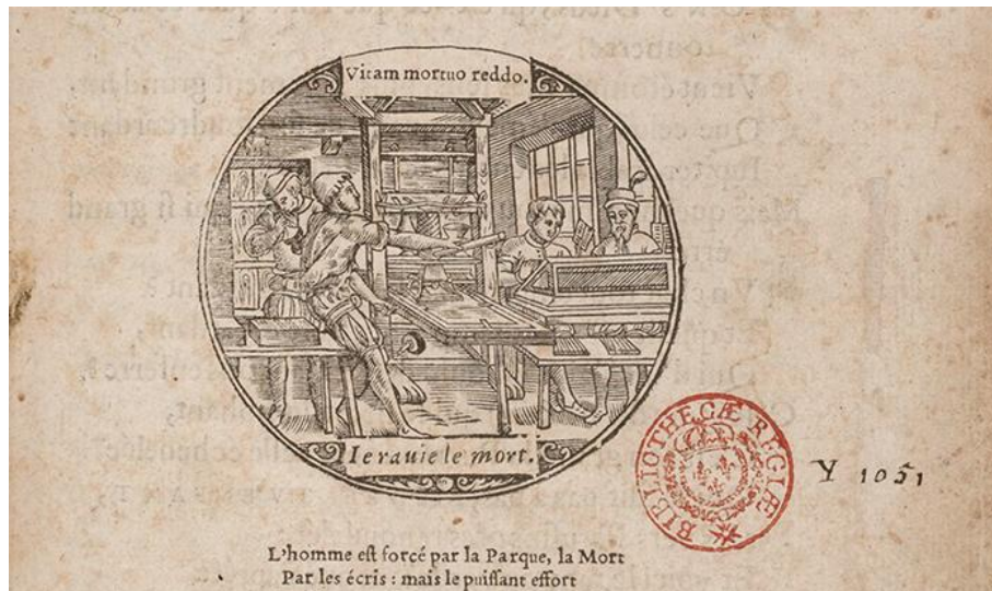
Couverture de Médée (s.d.), de La Pérouse.