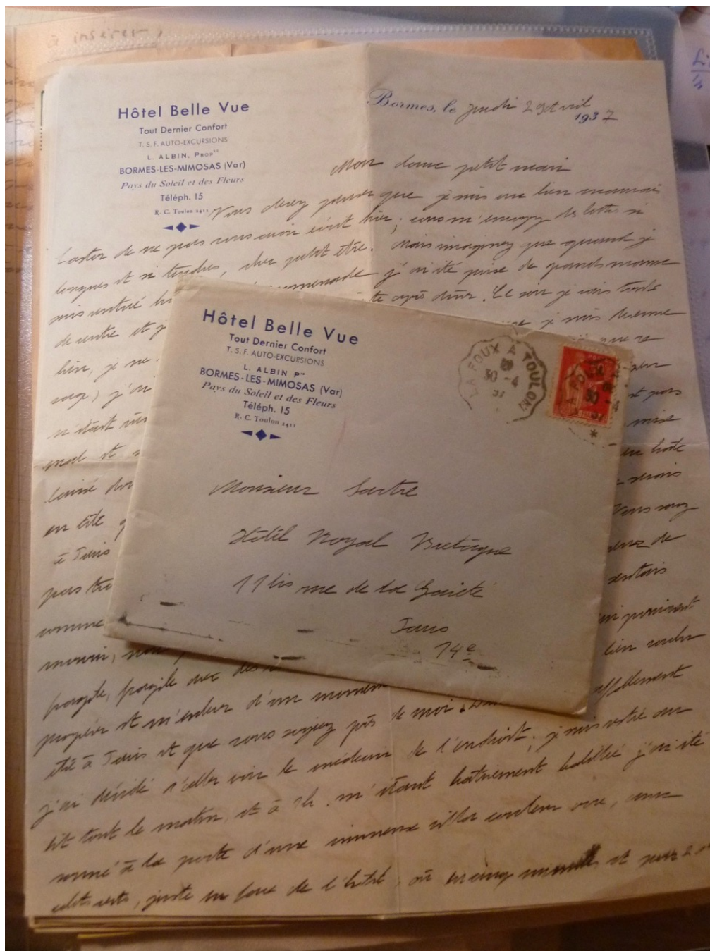
Lettre à Sartre 1937.

signifiantes. Je songe à une lettre de Sartre, de 1948, où il s'explique, chose rare, sur le sentiment qu'il éprouve envers elle, sur la nature du lien unique qui les unit. C'est très émouvant.