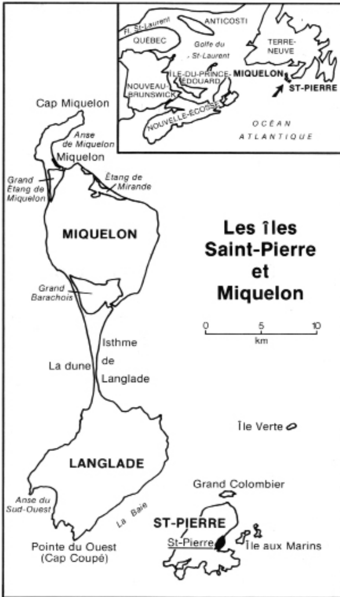
Fig. 1 Les îles Saint-Pierre et Miquelon.