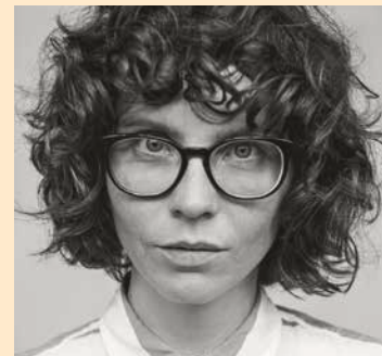
Jean Price-Mars, p. 57