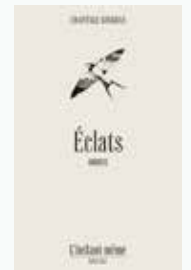
Chantale Gingras ÉCLATS