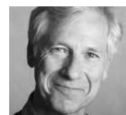
Par JEAN-PAUL BEAUMIER*

C'est simple, il te faut seulement ne pas trop réfléchir, saisir la hache, la lever très haut, et la gravité fera le reste : elle tombera toute seule, ce n'est pas toi qui trancheras la chair. Il faut tout bonnement te convaincre du caractère inévitable de cette mort. Prendre la hache, l'abattre. Prendre la hache, l'abattre. Tu ne peux pas te défilier.