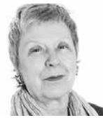
Entrevue réalisée par MICHÈLE BERNARD*

Pablo Neruda, Ode à Federico García Lorca