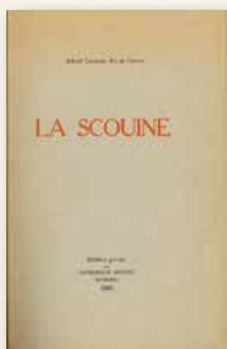
Édition originale de 1918

En tout cas, voilà à peu près ce que je savais lorsque, il y a cinq ans, j'ai lu La Scouine pour la première fois. Ce que j'ignorais, c'est que venait de s'enclencher un irrésistible mouvement qui me conduirait d'abord à réécrire le roman, puis à poursuivre au doctorat mes recherches sur cet écrivain fascinant, auteur non pas d'un seul livre, mais de quinze, dont le dernier, Lamento , sans doute trop sulfureux pour qu'il ose le publier de son vivant, dort encore dans les archives du Centre de recherche en civilisation canadienne-française de l'Université d'Ottawa.