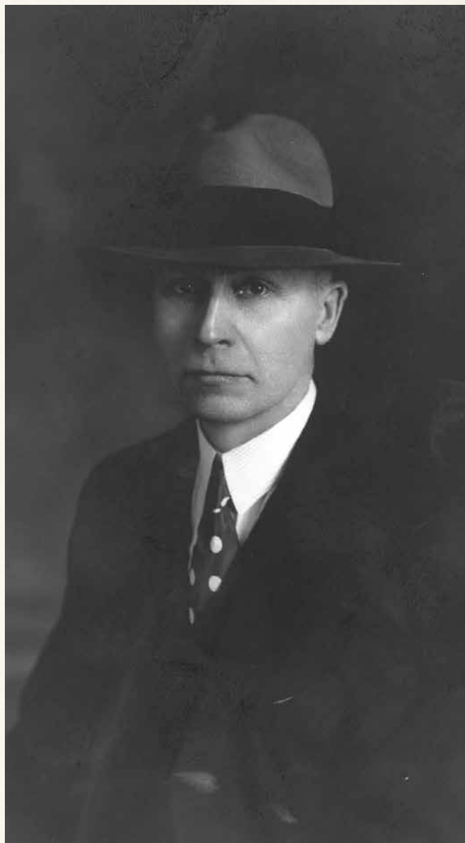
Albert Laberge vers 1930

Roman de la misère et du non-dit, La Scouine d'Albert Laberge était devenu, sous ma plume, celui des pulsions inavouées et des désirs enfouis. En choisissant cette voie, avais-je trahi l'esprit de mon prédécesseur, ou étais-je parvenu au contraire à saisir le mouvement intime de son œuvre, son élan secret ? Cette question, je me la suis bien sûr posée lorsque j'ai décidé d'approfondir ma connaissance de l'écrivain dans le cadre d'un projet de doctorat.