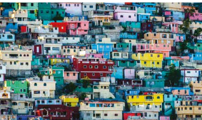
Quartier de Jalousie, Pétion-Ville