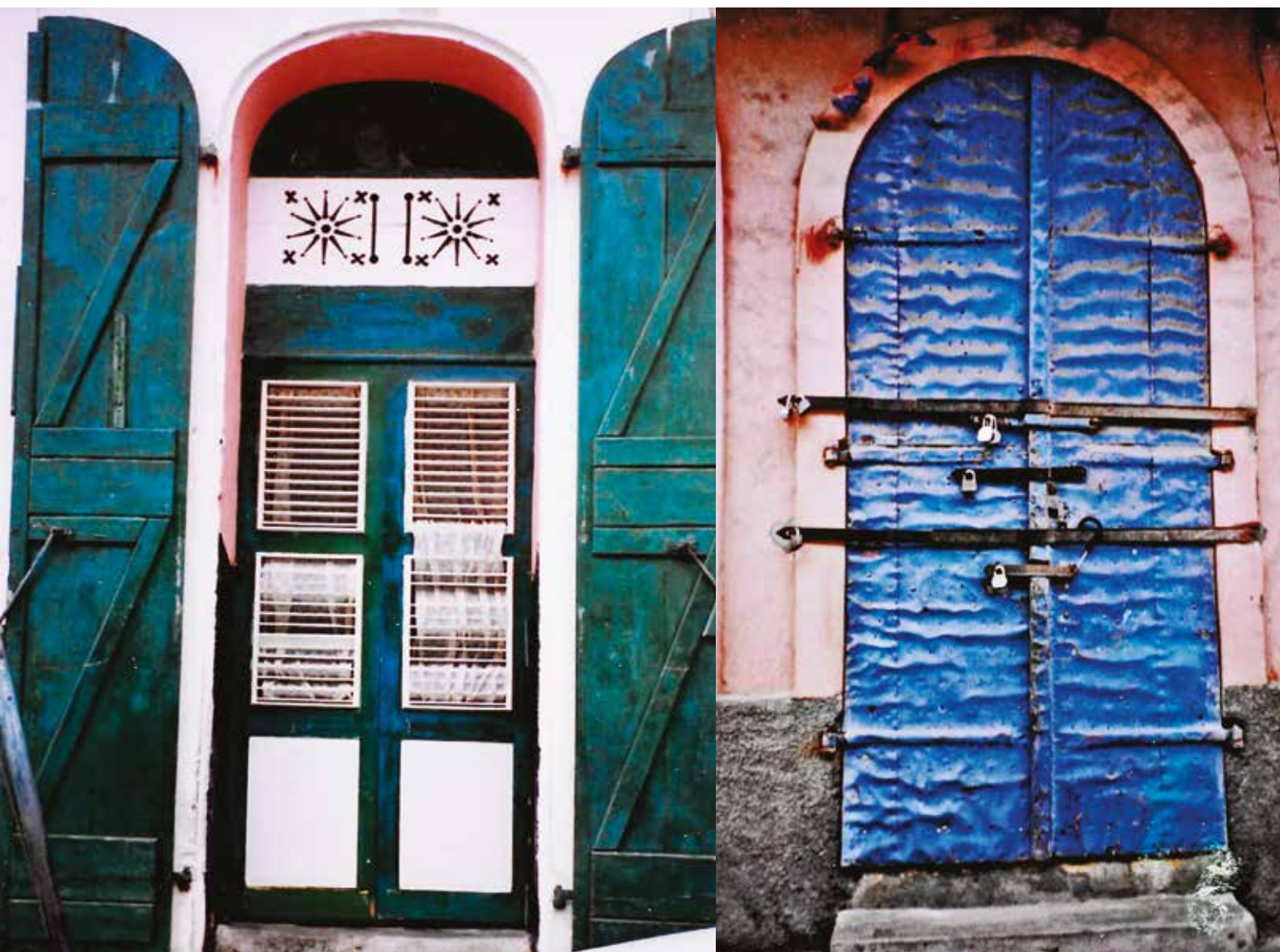
Portes de résidence et de commerce au Cap-Haïtien

L'ambiance est feutrée. L'horreur fait place à une tendresse aseptisée presque étouffante. J'ai une idée fixe : rentrer chez moi. Chez moi, c'est un appartement de la rue Chabot dans le quartier Rosemont, un magnolia près de l'escalier colimaçon en fer forgé, le silence des souvenirs, les toiles sur les murs et les livres qui attendent sur des étagères de bois. [...] La lumière de l'aube pénètre le jour. Un début de soleil est à l'horizon. Je pense au poème de Gérard Godin :