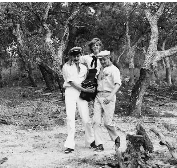
Henri Serre, Jeanne Moreau et Oskar Werner dans Jules et Jim