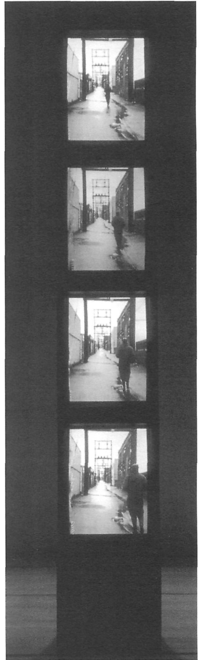
FIGURE 1 Waquant, Michèle En attendant la pluie/ Waiting for the Rain , 1987 4 moniteurs, support, 4 vidéo- grammes couleur, 11 min., son, 315 x 51 x 49,5 cm

La seconde conception oblige certes la mise en application de stratégies plus à risque comme la migration, mais assure, lorsque autorisée par l'artiste, une existence prolongée à l'œuvre. Reconduite de cette façon, on pourrait faire état, lors des futures présentations, de son passage d'un support ou d'un équipement à un autre. Le défaut de ces nouvelles formes de conservation ou de restauration réside dans leur caractère transmutable, où l'œuvre sera appelée à évoluer de génération en génération. Le danger serait d'en altérer profondément la nature, d'où l'importance d'en conserver les traces et de capturer, a priori , l'intention de l'artiste. Une des solutions tient peut-être dans la substitution des composantes, astuce qui peut permettre, si l'on pense à I Can't Hear You (Autochthonous) de Tony Oursler (Collection Musée d'art contemporain de Montréal, 1995), de faire fonctionner l'œuvre sans nuire à son esthétique, alors qu'en réalité la conception d'une régie dissimulant un lecteur DVD procure l'impression aux visiteurs que le lecteur VHS disposé devant l'œuvre demeure toujours opérationnel.