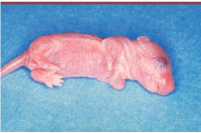
Figure 1. Souriceau nouveau-né fro/fro. La déformation des membres, notamment antérieurs, est très évidente dès la naissance. Le phénotype s'améliorera avec l'âge.

Les enzymes et métabolites de la voie sphingomyéline/céramide interviennent dans de nombreux mécanismes de signalisation, ainsi que dans la régulation de processus cellulaires majeurs tels que la prolifération cellulaire, l'apoptose ou encore la cytodifférenciation.