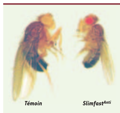
Figure 1. Mise en carence ciblée du corps gras. Chez la mouche de droite ( slimfast Anti ), le gène slimfast qui code pour un transporteur d'acides aminés est inactivé sélectivement dans le corps gras par un effet ARNi. La croissance générale est affectée, indiquant que le corps gras joue un rôle « senseur » de la nutrition.

En conditions de carence nutritionnelle, le corps gras affecte donc à distance la signalisation Dilp/InR dans les tissus de la larve. Cependant, l'expression des messagers DILP dans le cerveau n'est pas affectée par la carence en acides aminés, suggérant que le contrôle de la signalisation InR ne se fait pas directement au niveau de l'expression des ligands de type IGF. Une hypothèse possible pour expliquer ces effets est qu'en