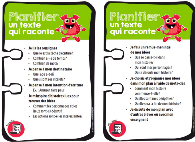
FIGURE 3. Affiche portant sur la planification de textes narratifs au 3 e cycle du primaire

Ces affiches ont été présentées aux enseignants pendant les journées de formation que nous leur avons offertes dans le cadre de notre recherche. Elles ne sont pas remises aux élèves pour un usage autonome; elles sont utilisées au cours de l'enseignement explicite, dans chacune des phases. L'enseignant les découvre avec eux, explique leur fonctionnement, modèle leur utilisation, questionne les élèves sur la façon dont ils recourent aux stratégies enseignées et sur les bénéfices qu'ils en retirent. L'affiche est donc un soutien à l'autorégulation, comme les acronymes du SRSD.