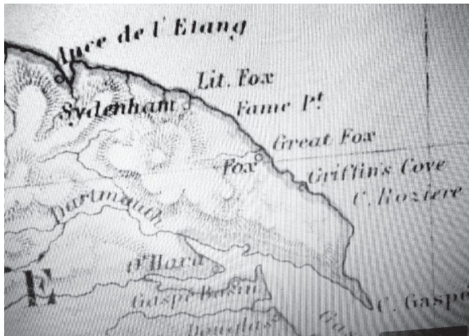
Détail de la carte d'Alexander Keith Johnson de 1861 où apparaît pour la première fois la mention « Fame Pt ».