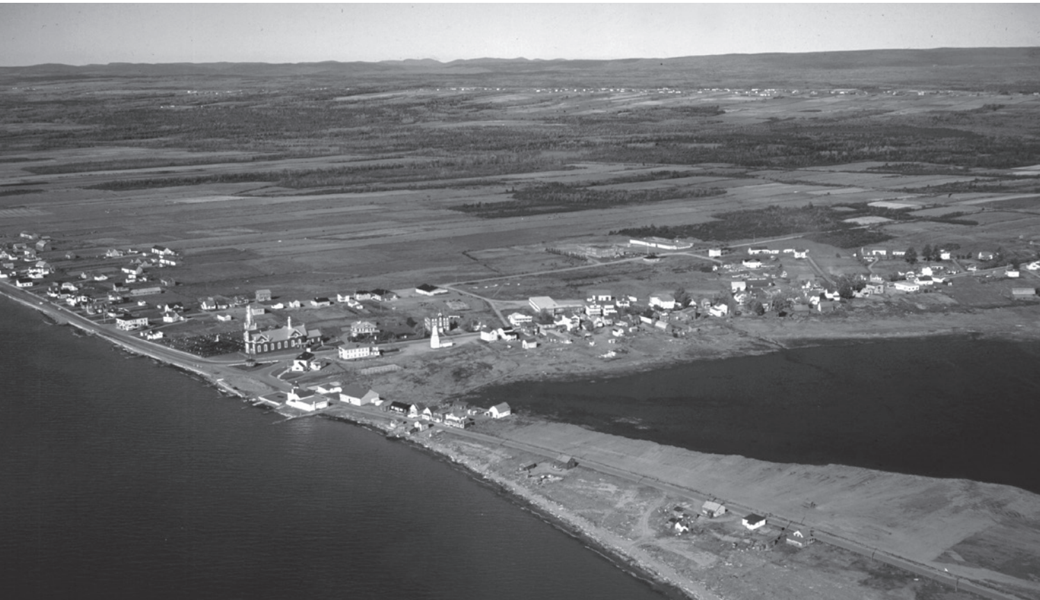
Vue aérienne de Bonaventure vers l'ouest.

En tant qu'entité administrative, Bonaventure passe par différentes phases et différentes appellations. Le hameau est peuplé dès 1761, mais ce n'est qu'en 1841 qu'on crée le district municipal de Bonaventure, puis la loi est modifiée quatorze ans plus