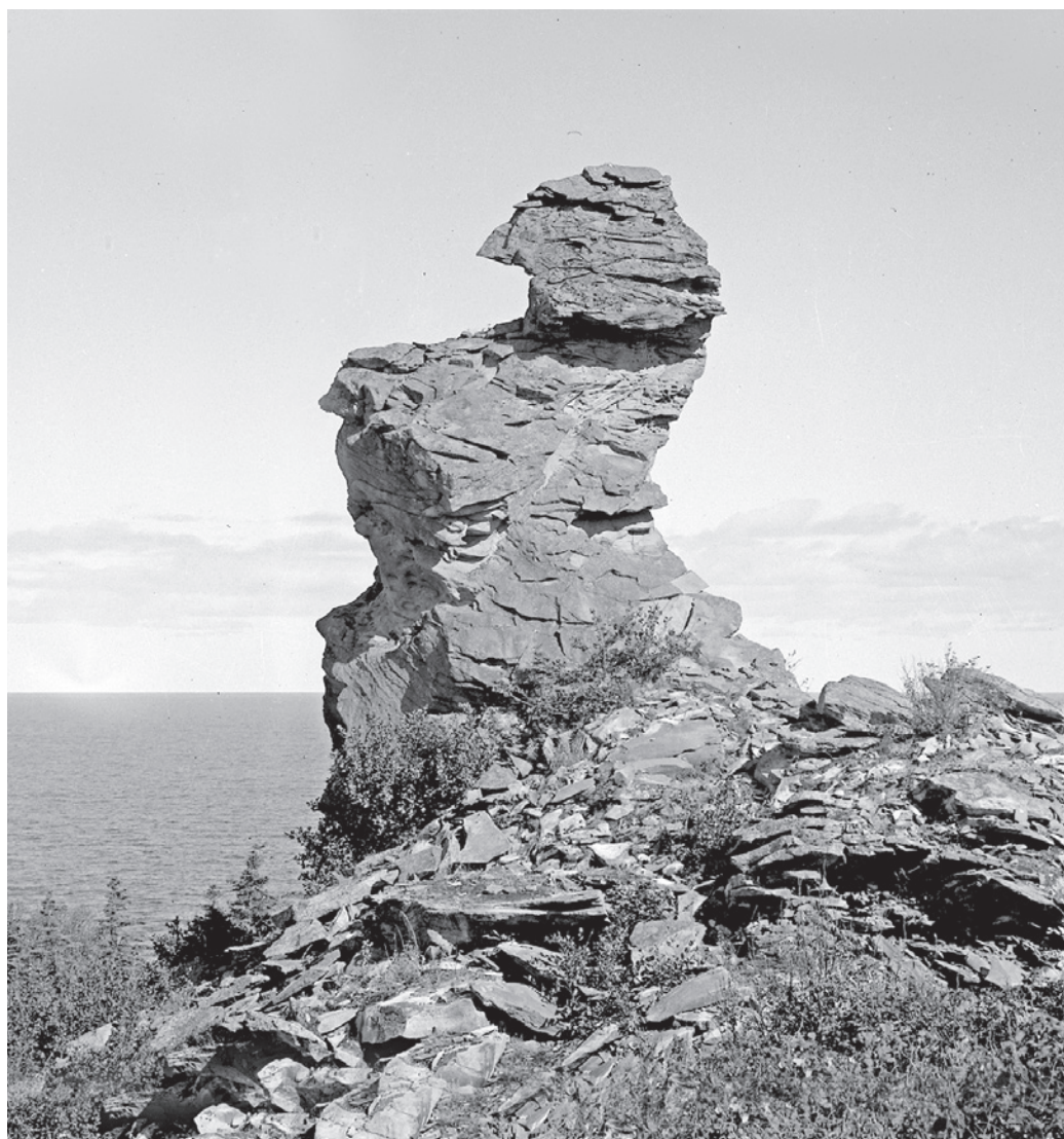
Le cap pouvant être à l'origine du nom du lieu Cap-Chat, 1941.

Puisque l'origine des toponymes de la Haute-Gaspésie est largement documentée, je me limiterai à caractériser le procédé de nomination auquel on a eu recours.