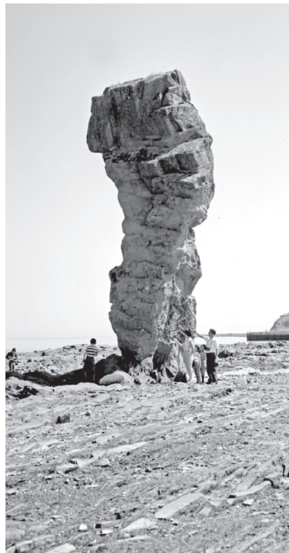
Ce monolithe est à l'origine du toponyme Tourelle.

Je fais ici un exercice qui illustre ce phénomène à partir d'une localité que je connais bien, Cap-Chat. Dans le langage courant des cap-chatiens, on entendra : la pointe au Goémon, l'Anse, la pointe à Mira, la pointe des Gagnon, le banc de Sable, le village de l'Anse, le Petit-Cordon, le Petit-Fonds, le Grand-Fonds, la coulée serrée, la côte à tuer, les crans-serrés, le plaqué des Belones, le ruisseau des Glaises, la Fonderie,