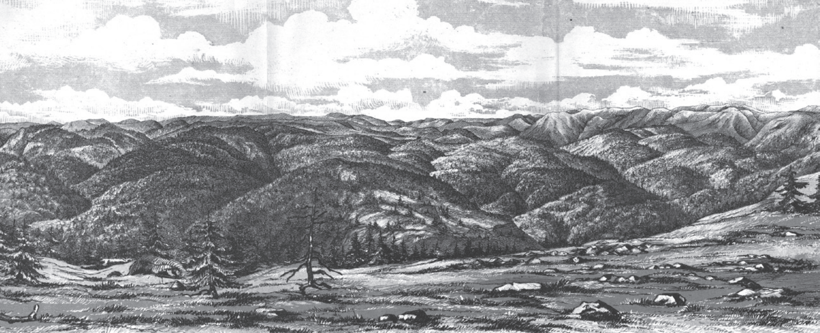
Gravure représentant les monts Chic-Chocs à partir du sommet du Mont Albert dans le Parc de la Gaspésie. Cette gravure a été utilisée pour illustrer le rapport de A. P. Low, Geological and Natural History Survey of Canada, 1883.

Image : L. Lambe, « Notre Dame or Shickshock mountains ». Musée de la Gaspésie. Collection Richard Gauthier. P162-5