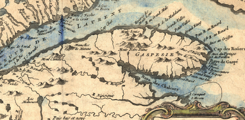
Détail de la « Carte du Cours du Fleuve de St Laurent » par Jacques Nicolas Bellin, 1754.