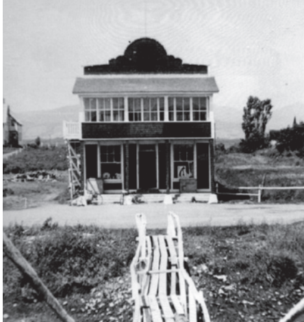
Le magasin d'Ida Fugère est à l'origine du lieu-dit « La fourche à Ida ».