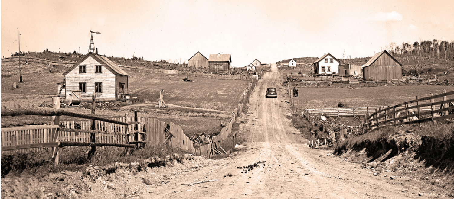
La colonie de Saint-Bernard-des-Lacs, près de Cap-Seize en 1941. Photo : Donat-C. Noisieux. BAnQQ, E6, S7, P1198

lieux dans la tradition. Noms géographiques et légendes toponymiques. » Sur les 414 noms de lieux habités qu'elle traite, 339 sont français, 44 anglais et 31 autochtones.