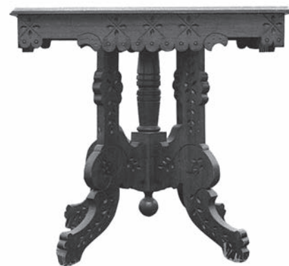
Table provenant du Colborne .

les églises protestantes du Bas-Canada. De plus, la cargaison compte toute une collection de vaisselle d'argent, spécialement commandée par Sir John Colborne, commandant en chef des troupes anglaises au Canada et grand amateur de belles choses.