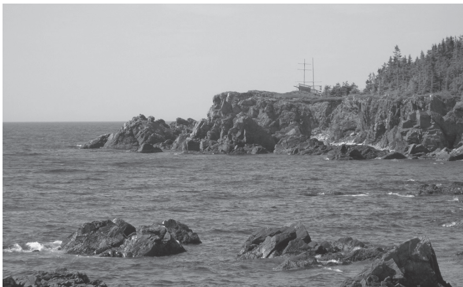
Parc commémoratif du Colborne à Gascons.

Le naufrage du Colborne est aussi entré dans la tradition orale. Dans son livre Le vaisseau fantôme – Légende étimologique , sœur Catherine Jolicoeur, spécialiste de la recherche ethnolo-