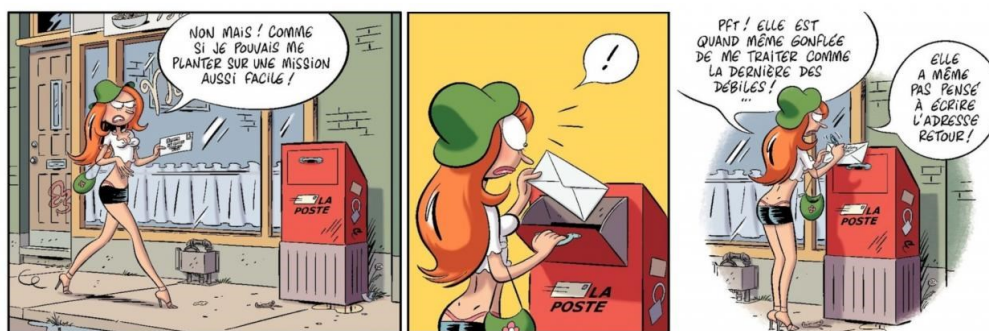
Image 4. Une boîte postale internationalisée, et donc conforme à aucune région du monde. Les Nombres . 5. Un couple d'enfer , Marcinelle, Dupuis, 2013, p. 15. Delaf, Dubuc © Dupuis, 2023.

un champ plus européen, divers filtres se mettant en place depuis l'assistant au dessin jusqu'à l'éditeur. Dans le même esprit, plusieurs lecteurs ont repéré à la page 15 du cinquième tome une boîte aux lettres atypique pour le lectorat européen : de fait, c'est une parfaite reproduction des boîtes postales de Postes Canada. Leur système d'ouverture et leur couleur rouge les rendent bien différentes des boîtes françaises, quand celles de Belgique partagent avec les boîtes canadiennes la couleur, mais pas le système d'ouverture. Face à un signe culturel pouvant créer la confusion chez le lectorat, même s'il est aisément identifiable dans le gag, Colpron confirme une des rares modifications directement apportée à la demande des éditeurs : une inscription « La Poste » bien française (alors même que l'éditeur est belge, rappelons-le) s'est trouvée ajoutée sur la boîte; quant au logo, il ne reprenait directement aucun des logos existants, tout en les évoquant.