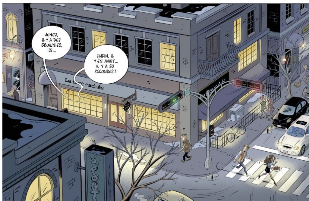
Image 3. Un croisement de rue typiquement québécois, entre ses bancs de neige de fin de saison et ses feux de croisement placés de l'autre côté des routes. Les Nombrils. 8. Ex, drague et rock'n'roll! , Marcinnelle, Dupuis, 2018. Delaf, Dubuc © Dupuis, 2023.

planches sont publiées, cette affirmation nouvelle pouvant s'expliquer aussi bien par une plus grande liberté de création, le succès étant désormais au rendez-vous. Par la suite, Fabio Lai, qui reprend le soutien au dessin à partir du septième tome, se fonde lui aussi dans les décors de Colpron. Italien vivant en Europe et n'ayant jamais mis les pieds au Québec, il cherche pourtant à reproduire activement des décors montréalais au moyen de recherches en ligne 35 . Ses décors en témoignent amplement et il a nécessairement fallu un effort réel à quelqu'un n'ayant jamais visité la province pour représenter des carrefours routiers où les feux rouges sont positionnés d'une manière bien différente de celle de l'Europe (t. 8, p. 47), chose qu'on ne voyait que très peu avant. Par cette action volontaire, il confirme que l'ancrage québécois des décors est clairement assumé par les assistants.