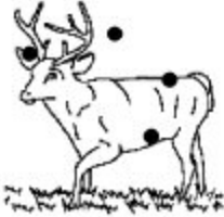
E. Pertinent Non valide Non fiable