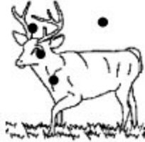
G. Pertinent Valide Non fiable