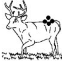
F. Pertinent Non valide Fiable