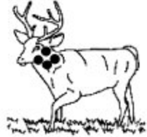
H. Pertinent Valide Fiable

Dans la situation A, le tir est non fiable parce que dispersé sur toute la surface de la cible fixe. Il est non valide, parce que la mesure manque de précision et ne peut attester l'atteinte de l'objectif. Il est enfin non pertinent puisqu'il ne correspond pas à l'objectif recherché et ne mesure donc pas, de toute façon, ce que je déclare vouloir mesurer.