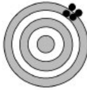
B. Non pertinent Non valide Fiable