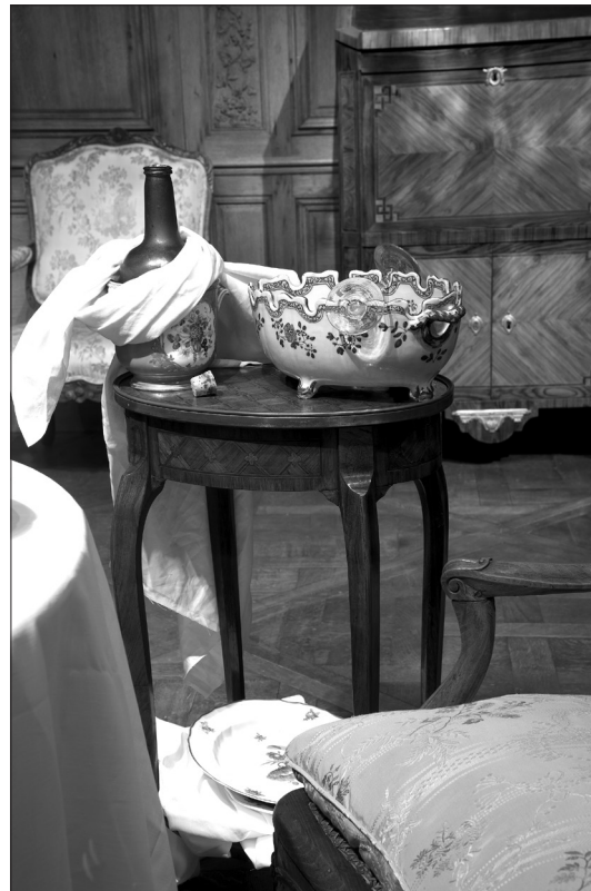
Fig. 3 Détail de la period room « Un Salon français vers 1750-1760 », Samuel European Galleries, niveau 3, Royal Ontario Museum, Toronto, 2018.