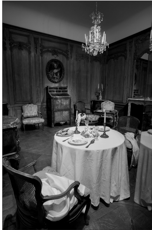
Fig. 2 Détail de la period room « Un Salon français vers 1750-1760 », Samuel European Galleries, niveau 3, Royal Ontario Museum, Toronto, 2018.