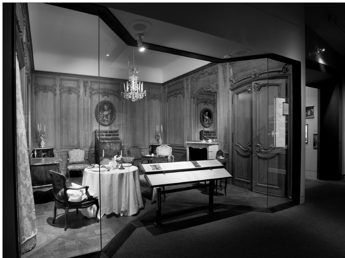
Fig. 1 Vue d'ensemble de la period room « Un Salon français vers 1750-1760 », Samuel European Galleries, niveau 3, Royal Ontario Museum, Toronto, 2018.

Au moyen de l'étude de la pièce « Un salon français vers 1750-1760 » présentée au Royal Ontario Museum de Toronto (Fig. 1), cet article analyse certaines des implications méthodologiques et épistémologiques issues du processus de (re)construction, d'interprétation et de médiation des récits historiques au moyen de la period room au musée. La première partie traite de la matérialisation de l'histoire dans la period room en étudiant l'organisation syntaxique des éléments qui composent ce « salon français ». Elle montre ainsi comment la mise en exposition peut produire des « effets de récit » dont l'articulation repose sur l'investissement narratif du visiteur, et ce, peu importe la lecture qu'il ou elle fera de la mise en scène qui lui est proposée 3 . La seconde partie considère les effets du contexte muséal pour la valeur du récit en tant qu'outil de construction et de transmission de connaissances. Elle révèle comment la period room articule les tensions entre la légitimité scientifique de l'institution et la valorisation de l'expérience des visiteurs. En fin de compte, cette étude contribue à expliquer