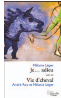
Prise de parole