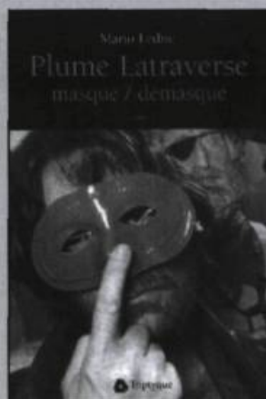
MARIO LEDUC Plume Latraverse masqué / démasqué essai, 226 p., 22 $

«Les gens ont fait le choix de te ranger pour toujours dans un cercueil étanche et insonorisé. Moi je te propose un nid de feuilles tout près de la vie qui jase. Installe-toi. Vois comme je t'écris. Ne t'arrête pas au décès qui n'a plus d'importance. Entre avec moi dans le pays handicapé par la sécheresse, dans la villa blanche rue des bougainvillées, saisis ta Lucia, repartons tous à bord du ferry, for ever sur le ferry...»